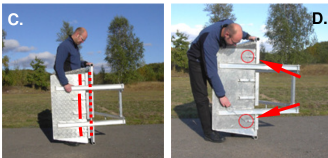
C. Bottenplattans U profil passas in i ramen. D. Frigör och lås bottensprintar i ramens låshål, Kontrollera att röd markering inte syns.