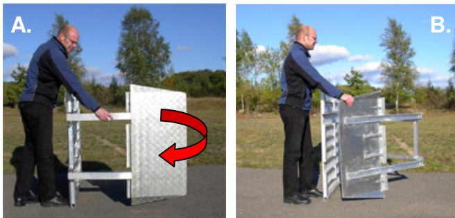
A. Placera enheten på sida. B. Fäll ut bottenplattan och rotera.